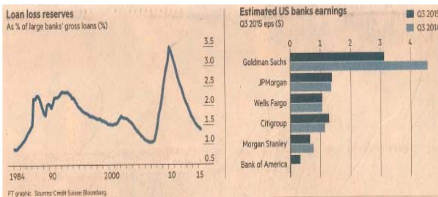
FT graphic.