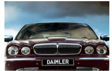
ราคาหุ้น DAIMLER ย้อนหลัง