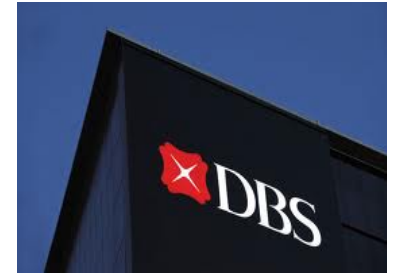
ราคาหุ้น DBS เทียบกับ MSCI Singapore Financials Index