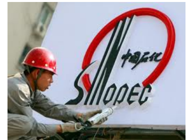
ราคาหุ้น Sinopec ย้อนหลัง