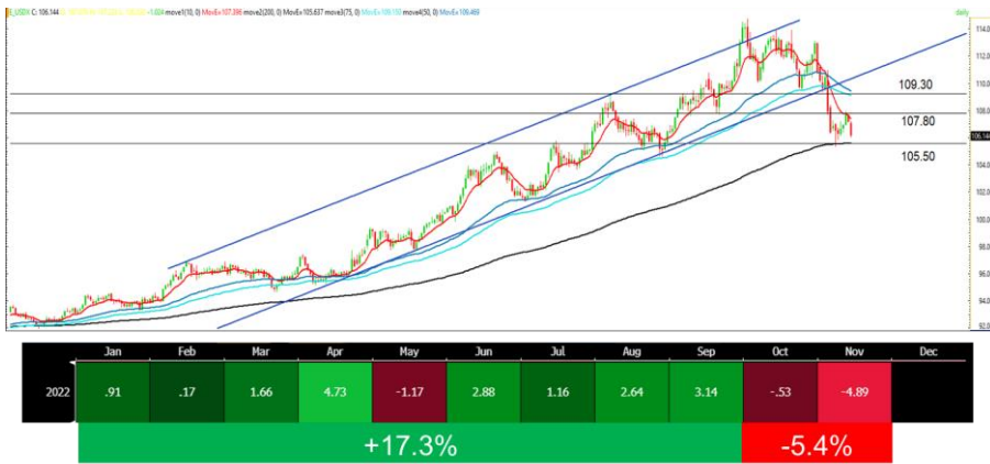
ทิศทางค่าเงินดอลลาร์สหรัฐ (ytd)

แนวโน้มการเร่งขึ้นดอกเบี้ยของ Fed ที่ชะลอลง หลังจากขึ้นดอกเบี้ย 0.75% ต่อเนื่องถึง 4 ครั้งติดกัน ทำให้อัตราดอกเบี้ยนโยบายเข้าใกล้เพดานที่ตลาดคาดช่วง มี.ค. 66 ที่ 5.25% (ล่าสุดอยู่ที่ 4%) หนุนให้ Dollar Index ที่แข็งค่าขึ้นมาเร็ว โดยตั้งแต่ มี.ค. - ก.ย. 65 ปรับขึ้น 17.3% เริ่มกลับมาอ่อนค่าลงในเดือน ต.ค. 65 - ปัจจุบัน -5.4%