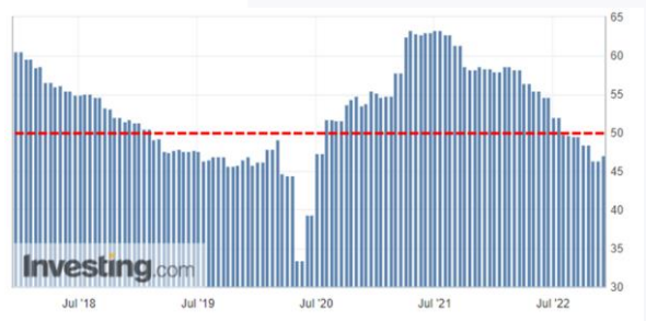
ที่มา: Investing.com, ฝ่ายวิจัย ASPS

สำหรับภาคการผลิตในภูมิภาคเอเชีย ประเทศส่วนใหญ่เข้าสู่ภาวะหดตัว อาทิ ไต้หวัน, ญี่ปุ่น, เกาหลีใต้, อินโดนีเซีย ฯลฯ เนื่องจากผลกระทบของการดำเนินนโยบาย Zero-Covid ในจีน ทำให้ Supply Chain ระหว่างประเทศหยุดชะงัก อย่างไรก็ตาม PMI ภาคการผลิตในบ้านเรา เดือนพ.ย. อยู่ที่ระดับ 51.1 จุด ซึ่งยังถือว่าดูดีเมื่อเทียบกับประเทศอื่นๆ