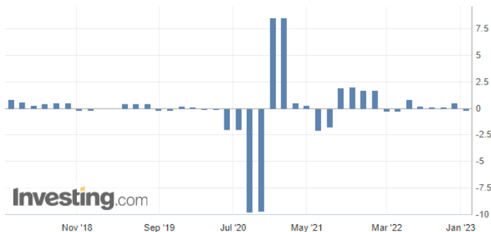
GDP Germany QoQ

เยอรมันประกาศตัวเลข GDP อยู่ที่ระดับ+0.5% YoY, -0.2% QoQ ต่ำกว่าที่ตลาดคาด +0.0% QoQ สะท้อนให้เห็นสัญญาณการชะลอตัวทางเศรษฐกิจในทวีปยุโรป เนื่องจากเยอรมันถือเป็นประเทศที่ใหญ่ โดย GDP ที่ปรับตัวลดลงเป็นผลมาจาก ต้นทุนค่าครองชีพที่สูงขึ้นของประชาชนจากราคาพลังงาน ส่งผลให้การใช้จ่ายภาคครัวเรือนปรับตัวลดลง ทั้งนี้เยอรมันนี้และสหภาพยุโรปอาจเข้าสู่ภาวะเศรษฐกิจถดถอยทางเทคนิค เนื่องจากสงครามรัสเซียยูเครนที่ยังปะทุอย่างต่อเนื่อง เงินเฟ้อที่ยังคงอยู่ในระดับสูง (CPI EU เดือนธ.ค. อยู่ที่ระดับ 9.2% YoY) รวมถึงตลาดคาด ECB จะดำเนินนโยบายการเงินที่เข้มงวดต่อไป (ตลาดคาด ECB ขึ้นอัตราดอกเบี้ยระดับ 50 bps ขณะที่คาด FED ขึ้นอัตราดอกเบี้ยระดับ 25 bps)