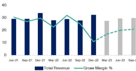
Revenue and Gross margin