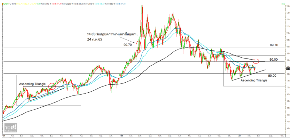
ราคาน้ำมันดิบ Brent

AP FV@B 15.50 CBG FV@B 111.00 PTTEP FV@B 178.00