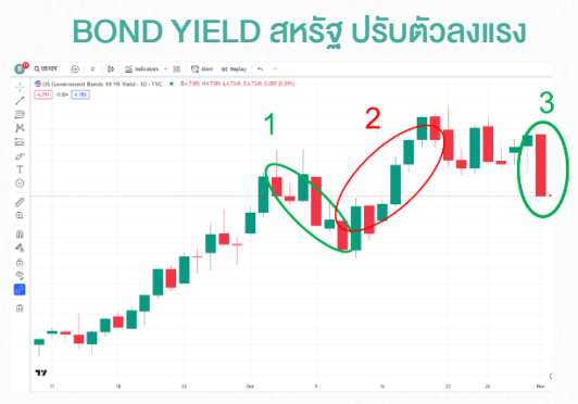
ช่วงที่ 1 (9 – 11 ต.ค.) SET +1.2%, Fund Flow Net Buy +4.6 พันล้านบาท ช่วงที่ 2 (12 – 19 ต.ค.) SET -2.3%, Fund Flow Net Sell -4.6 พันล้านบาท ช่วงที่ 3 (2 พ.ย.) SET ?%

ประเมิน SET INDEX มีโอกาสผันผวนลดลง และฟื้นตัวได้มากขึ้น ส่วนกรอบการเคลื่อนไหววันนี้ที่ 1375 – 1390 จุด และหุ้น TOP PICK คือ TISCO, BH และ WHA