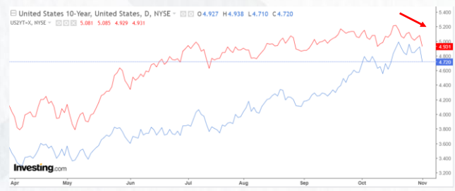
ที่มา: INVESTING, สายงานวิจัย บล. เอเซีย พลัส