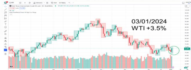
ที่มา: Tradingview, สายงานวิจัย บล. เอเชีย พลัส