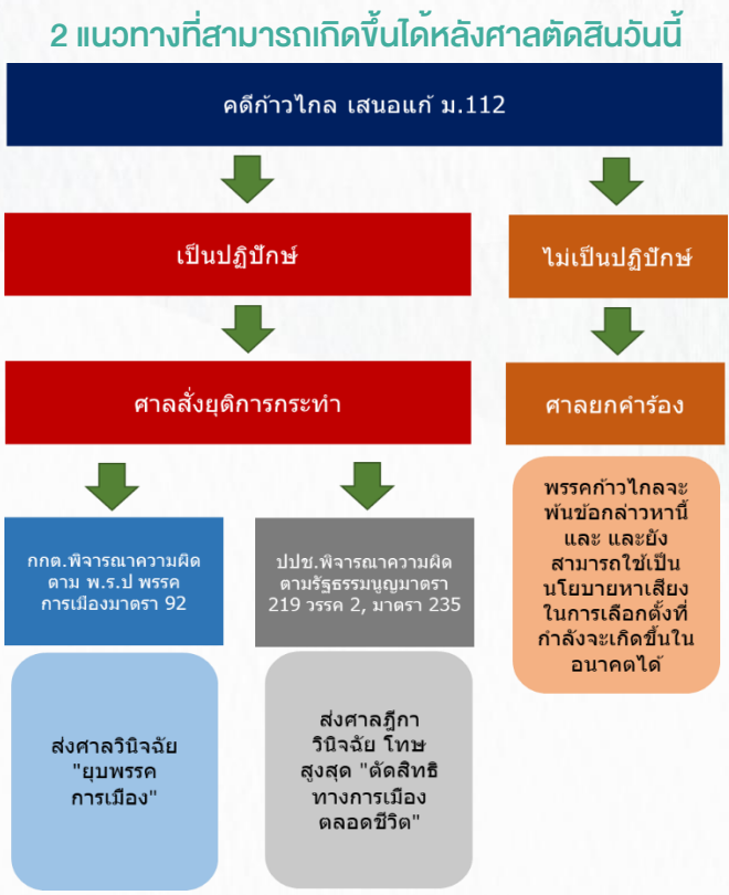
ที่มา: กรุงเทพธุรกิจ, สายงานวิจัย บล. เอเชีย พลัส

สมัครรับเลือกตั้งของคณะกรรมการบริหารพรรคการเมืองนั้นได้(ตาม พ.ร.ป พรรคการเมืองมาตรา 92) หนึ่งเดียวกันทางฝั่ง ปปช. ก็สามารถพิจารณาว่าผิดต่อหลักจริยธรรมร้ายแรงหรือไม่(ตามรัฐธรรมนูญมาตรา 219 วรรค 2, มาตรา 235) ซึ่งหากศาลวินิจฉัยแล้วว่าผิดจริง โทษสูงสุด คือ การตัดสิทธิทางการเมืองตลอดชีวิต