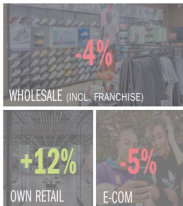
FY 2023 CHANNEL GROWTH