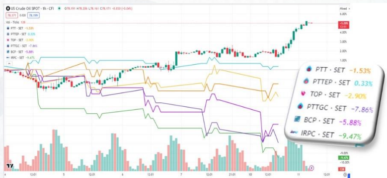
ที่มา: TRADINGVIEW, ASPS

หุ้นน้ำมันน่าจะมีโอกาสฟื้น หลัง LAGGARD มา 1 สัปดาห์