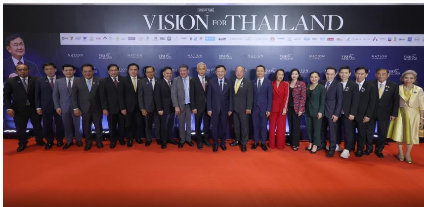
ที่มา: NATION TV, สายงานวิจัย บล. เอเชีย พลัส