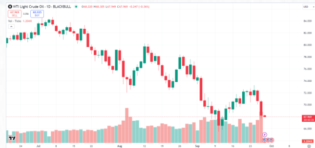
ที่มา: TQ PROFESIONAL , สายงานวิจัย บล. เอเชีย พลัส