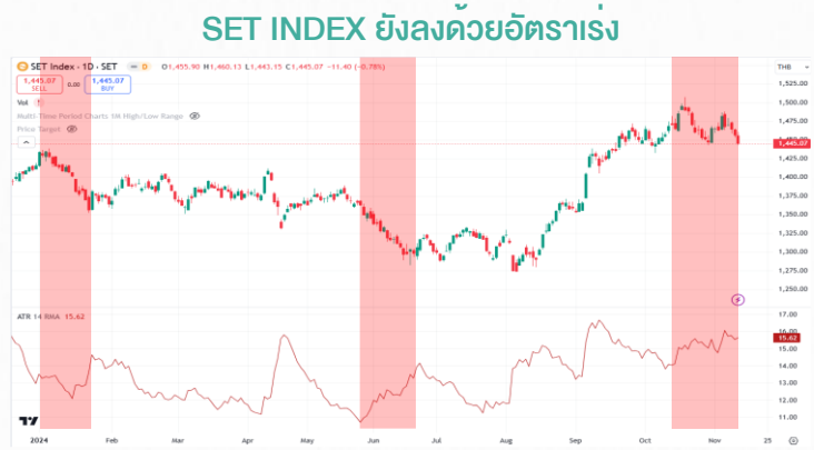
ที่มา: SET, สายงานวิจัย บล. เอเชีย พลัส (ณ 12 พ.ย. 67)

SET INDEX ยังคงปรับตัวลงในอัตราเร่งขึ้น สะท้อนได้จากกรอบการเคลื่อนไหวเฉลี่ย ใน 14 วันที่ผ่านมา หรือค่า AVERAGE TRUE RANGE (ATR) ที่เร่งขึ้นเกือบสูงสุดของ ปีที่ 15.6 จุด ปัจจัยดังกล่าวมักจะมีตามมาด้วยการย่อตัวลงต่อของดัชนี